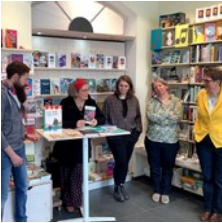
Die Münchner Buchmacher