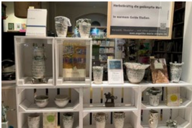
Poetical Things. Lyrik im Buch oder auf Keramik. Kooperation