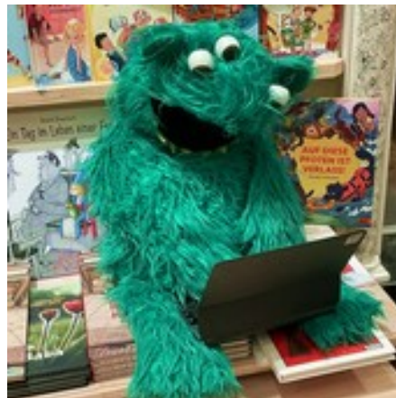
Digital auf Zack