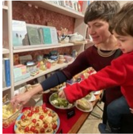
Snacktime bei Buchpremierern