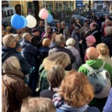
vor dem Buchpalast