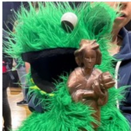
auch mal die Momo halten