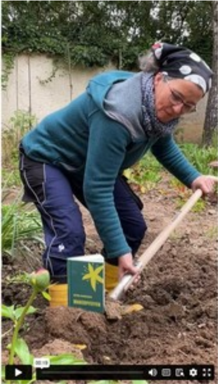
https://vimeo.com/942230526 Verbrecher Verlag