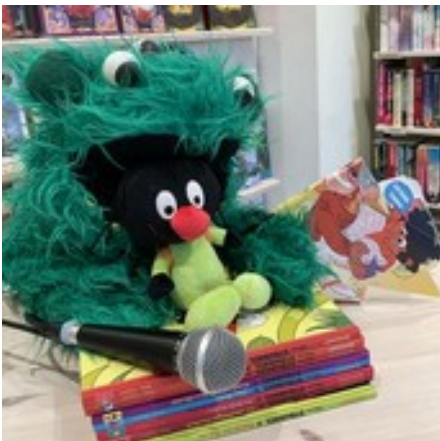
Freunde, Strubbel (Reprodukt)