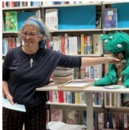
Die Momo im Buchpalast