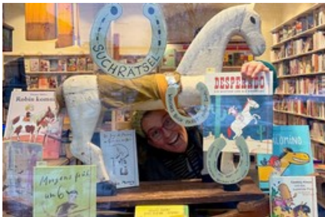
Gewinnspiel: In wildem Galopp. Welches Buch passt nicht in die Reihe? (Morgens früh um 6. Die Hexe reitet auf dem Besen)