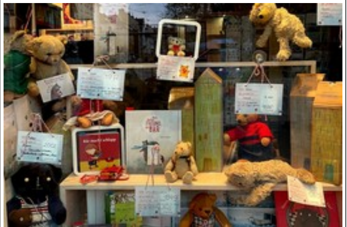
Bärenausstellung: Mein bester Freund, der Bär (Mixtvision) Bringt euren Kuschelbären vorbei. Wir bekamen 20 Exemplare von 1946-2018)