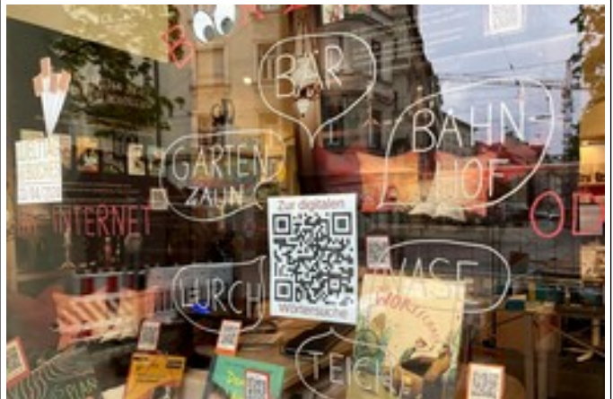
Geheimwörterjagd zum Welttag des Buches. Digital und analog