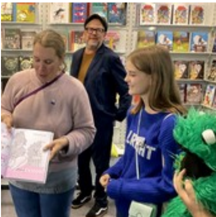
bei Reprodukt und Kibitz