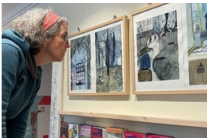
Ausstellung: Traumtage, Aquarelle original Limbion Verlag