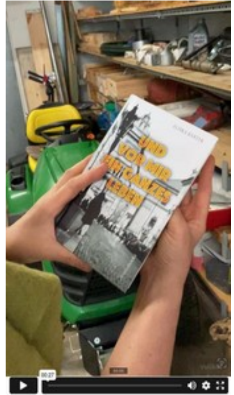
https://vimeo.com/948038825 Verlag Weissbooks