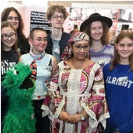
Djaili Amadou Amal, Bücherfresser