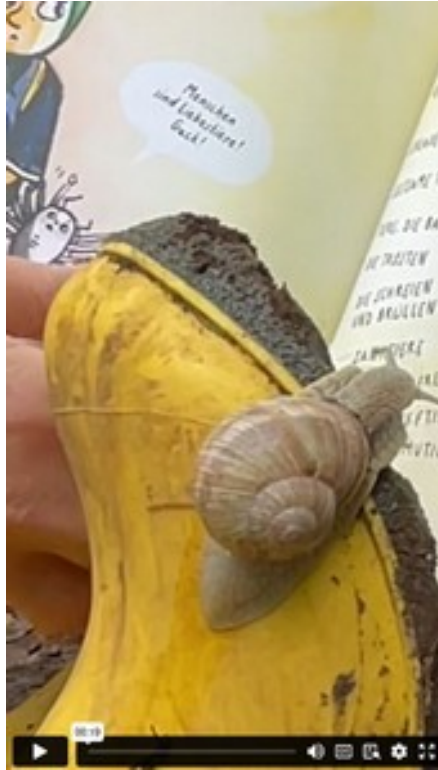
https://vimeo.com/943191061 Limbion Verlag