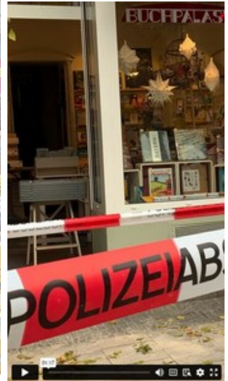
Hingucker Schaufenster. 50 Variationen